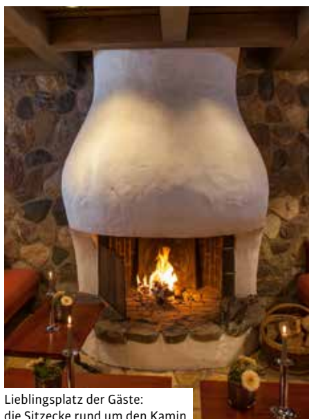
Lieblingsplatz der Gäste: die Sitzecke rund um den Kamin