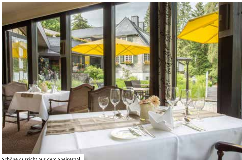
Schöne Aussicht aus dem Speisesaal