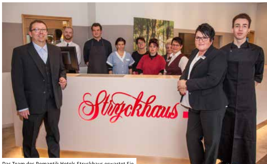
Das Team des Romantik Hotels Stryckhaus erwartet Sie