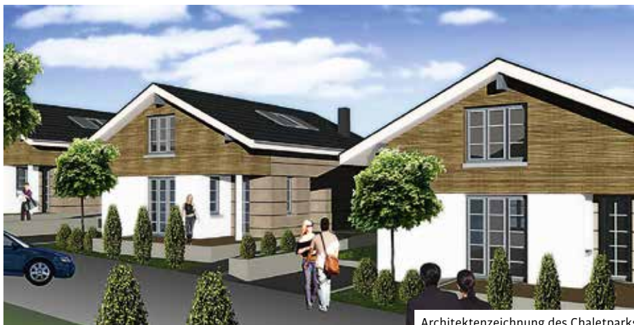
Architektenzeichnung des Chaletparks

Weiterhin wurden sowohl das Restaurant „Seaside“ und die beiden Gasträume als auch 25 Zimmer und 12 Bäder erneuert bzw. renoviert.