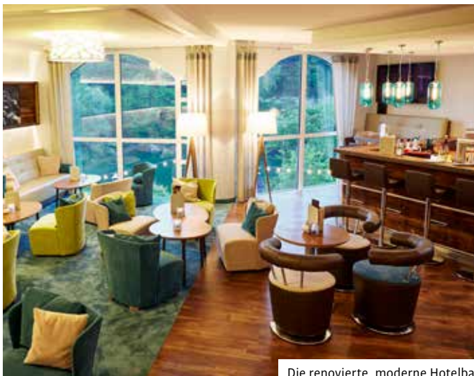
Die renovierte, moderne Hotelbar