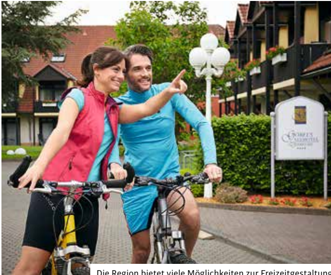
Die Region bietet viele Möglichkeiten zur Freizeitgestaltung