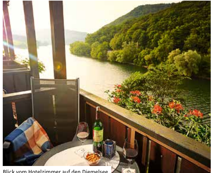
Blick vom Hotelzimmer auf den Diemelsee

handelt werden“, urteilt Gert Göbel. Denn die Erfahrungen zeigen: „Wo die Qualität stimmt, läuft es“. So wurde auch in 2015 wieder kräftig investiert.