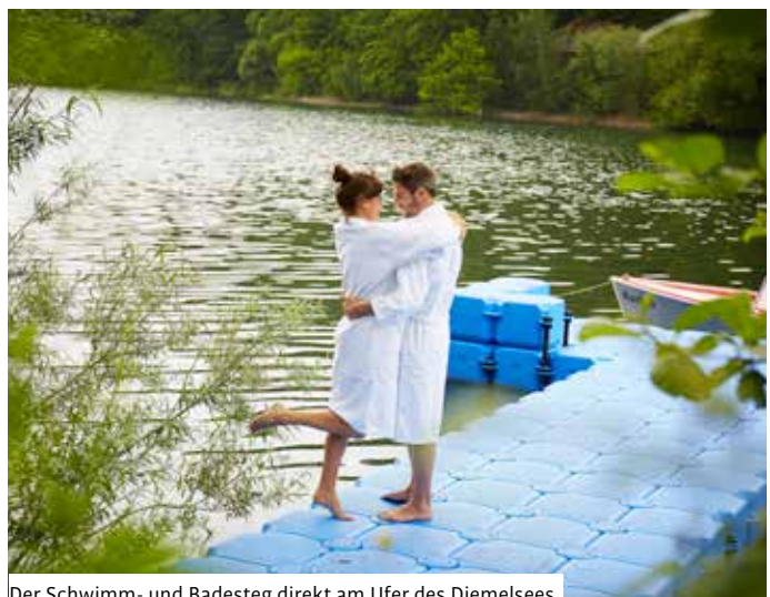
Der Schwimm- und Badesteg direkt am Ufer des Diemelsees